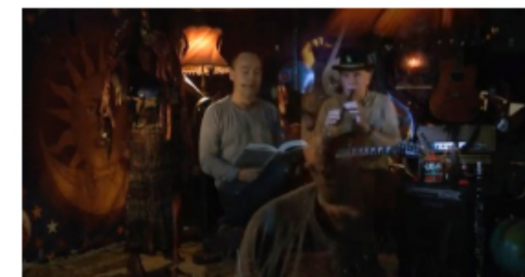
Hippie 1 Lydbogsmusikvideo