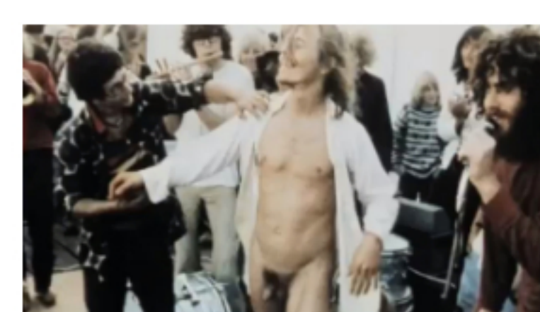
Reklame for HIPPIE 2