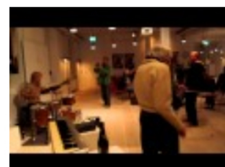
Fra receptionen for HIPPIE 2